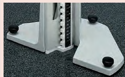
601167 (опция) Опорное основание для вертикальной установки